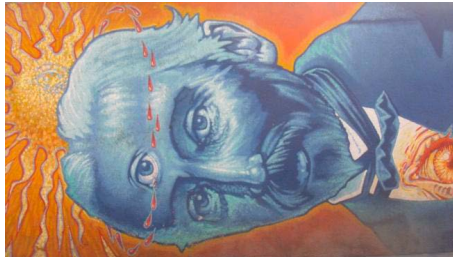
Figura 2. Mural Camino a R. Gil