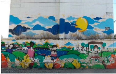
Figura 5. Mural ecosistema cultural