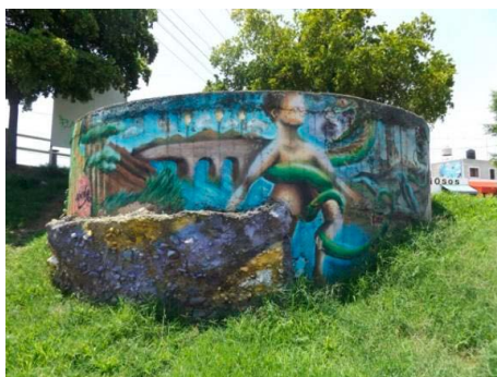
Figura 4. Mural Chavarín

tura circular del sistema de aguas de tres metros de diámetro, abarcando tres cuartas partes de la circunferencia (consultar la Figura 4). Cabe resaltar que este mural es una nueva versión de otro (en el tema, el autor, el estilo) que era más grande y se ubicaba en la misma Calzada hasta el año 2018, pero fue sustituido por un anuncio de alimento balanceado para animales.