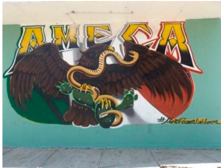
Figura 3. Mural Patriota

12 metros cuadrados (ver la Figura 3). Sustituyó una pintura tipo rótulo que contenía un anuncio de venta de cerveza, ya que el negocio cerró.