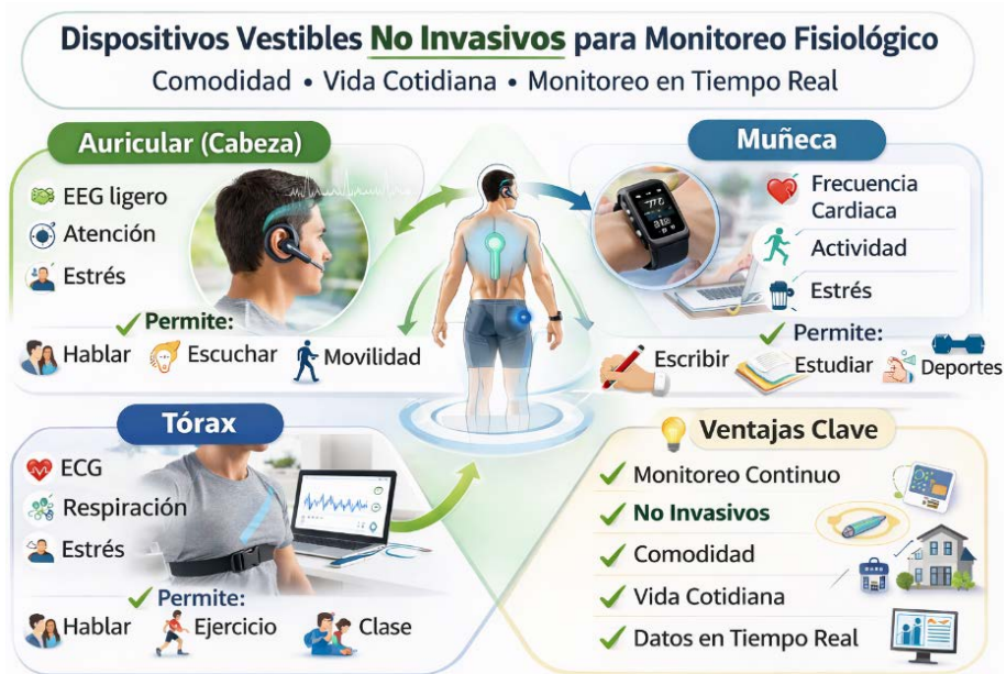
Figura 2 Dispositivos vestibles que pueden ser utilizados para fines educativos.

El presente capítulo proporciona una revisión sintética de la neuroeducación, sus convergencias pedagógicas con la Nueva Escuela Mexicana y cómo el uso de dispositivos y sistemas de monitoreo no invasivo fortalece el aprendizaje significativo en entornos reales.