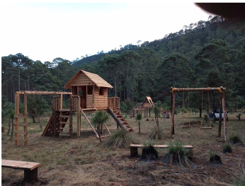
Figura 2. Equipamiento Turístico de Recreación