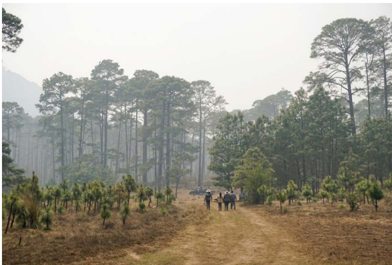
Figura 3. Senderos de la Localidad