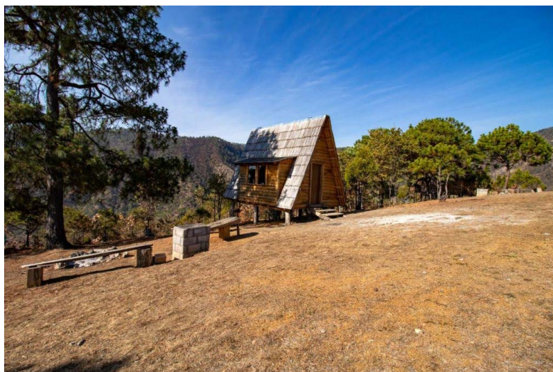
Figura 4. Equipamiento Turístico de Alojamiento