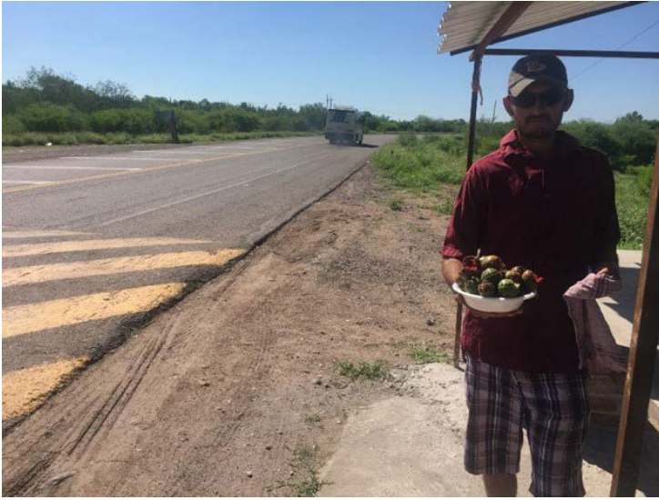
Figura 3. Venta de frutos en puestos a la orilla de la carretera Los Mochis-El Fuerte

Los frutos son recolectados con el bacote (Figura 4), un instrumento elaborado con una vara larga de carrizo ( Arundo donax L.) y, en ocasiones, con el escapo de un maguey ( Agave angustifolia Haw.); en un extremo se colocan una espátula de madera y una punta de metal para pinchar el fruto y recolectarlo. En Sonora, se le conoce con el mismo nombre o jíabuia en lengua Mayo-Yoreme, construido, en su mayoría, con el escapo floral del mezcal ( Agave vivipara L.) (Yetman y Van Devender, 2002). Los Seris, en la costa de Sonora, utilizan un instrumento parecido que nombran aktáappa, y consiste en una vara de aproximadamente 4 m de longitud con una espátula de mezquite ( Prosopis glandulosa torreyana (L. D. Benson) M. C. Johnst.) amarrada a uno de los extremos, así como un alambre o pieza de metal puntiaguda que sobresale para pinchar los frutos (Felger y Moser, 1974). En Choix y San José del Llano en Badiaguato se utiliza un instrumento llamado gancho pitayero, pitayero o wichuta, el cual se elabora con una vara de 5 a 7 m de carrizo ( Arundo donax L.), a la cual le coloca en la punta una espátula o arco de madera y una punta para pinchar el fruto de S. montanus (Salomón et al., 2022).