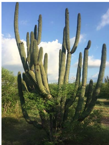
Figura 1. Aspecto de Stenocereus thurberi (Engelm.) Buxb. (Cactaceae) en poblaciones silvestres del municipio de El Fuerte al norte de Sinaloa

(Parker, 1987), contienen una pulpa dulce muy apetecible, usualmente de color rojizo a granate y a veces blanca o anaranjada.