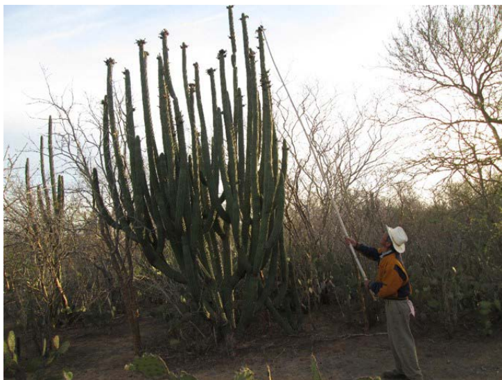
Figura 4. Utilización de vara de carrizo ( Arundo donax ) como instrumento para recolectar frutos de pitaya, llamado localmente “Bacote”

La recolección de los frutos la llevan a cabo, en su mayoría, hombres acompañados en parejas o en grupos de tres o más personas. Esto es derivado de los conflictos sociales que se viven en la región, mientras que en el pasado reciente (diez años atrás), los individuos de cualquier miembro de la familia podrían recolectar, tal como sucedía en otras regiones del país. Por ejemplo, en la Mixteca Baja, las pitayas de otras especies de Stenocereus eran colectadas por los niños, mujeres, ancianos y hombres adultos (Luna-Morales y Aguirre, 2001); en el valle de Tehuacán, Puebla, el garambullo ( Myrtillocactus schenckii (J.A. Purpus) Britton & Rose) es recolectado, en su mayoría, por niños (Blancas-Vázquez, 2007).