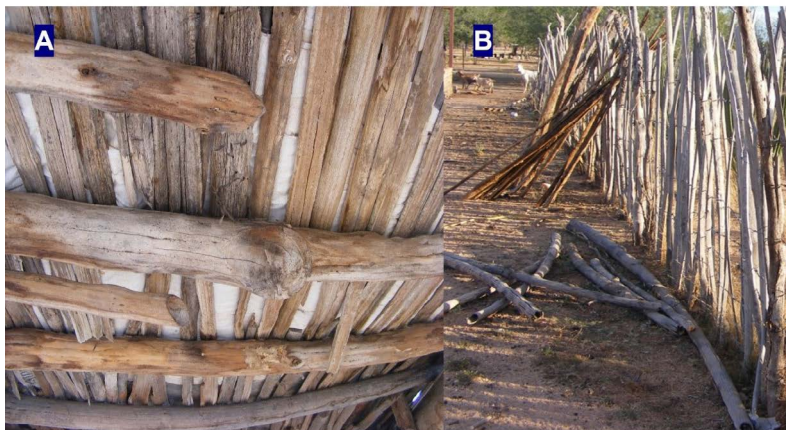
Figura 5. Utilización de tallos secos de Stenocereus thurberi en la construcción de tejabanas (A) y cercos (B)

El uso de S. thurberi es considerado por los encuestados como un recurso forestal que forma parte de una tradición que fue heredada por sus antepasados y se ha transmitido por generaciones. El 76 % de los entrevistados respondieron que el aprovechamiento actual de la especie se debe a los conocimientos heredados por sus padres y abuelos. Además, comentan que iniciaron con esta práctica cuando tenían entre seis y diez años, cuando acompañaban a sus padres o abuelos. En un estudio previo (Márquez, 1997), al estudiar la etnobotánica del norte de Sinaloa, consigna para S. thurberi que el aprovechamiento que se le da es por el conocimiento heredado de sus antepasados.