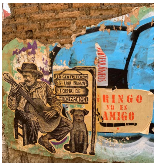
Nota: Fotografía de Elke Köppen, 2024.

En una esquina céntrica en el corazón de Jalatlaco hay dos carteles que denuncian la gentrificación (véase Imagen 39). También los muros de la calle República, vía principal que divide Jalatlaco del centro de Oaxaca están llenos de graffiti contra la turistificación y los moradores extranjeros que acaparan vivienda y la encarecen como la vida misma.