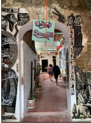
Nota: Fotografía de Elke Köppen, 2024.