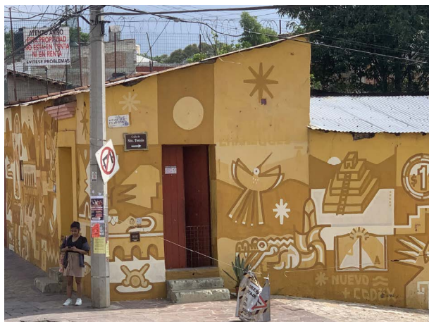
Imagen 34. Casa pintada por Chávez