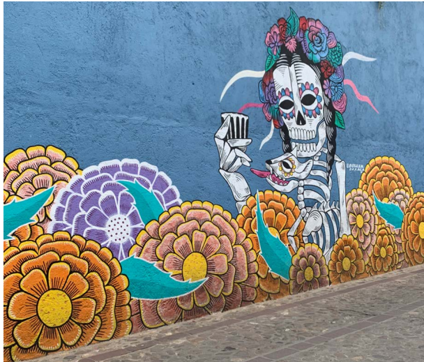
Nota: Fotografía de Elke Köppen, 2024.

Otro artista llamado Curiel también tiene presencia amplia en el barrio y destaca por las boquitas características de sus personajes. Hay gran variedad y abundancia más de murales sobre todo en las fachadas principales de comercios, pero se pudo constatar nuevamente que predominan temas relacionados con el Día de Muertos en las calles más centrales de Jalatlaco.