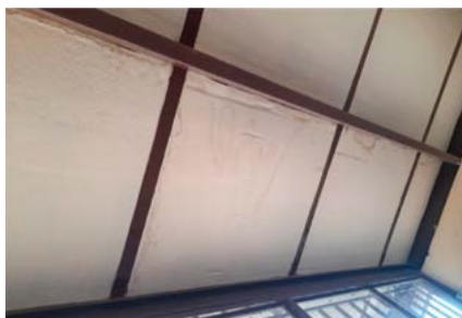
Imagen 4. Filtración de agua en el aula