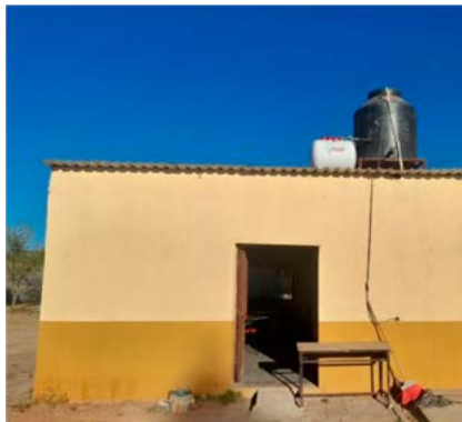
Imagen 2. Bodega adaptada como aula