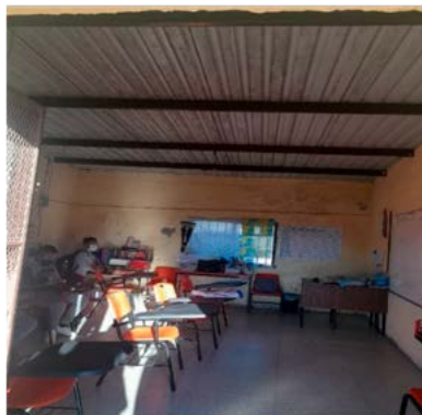
Imagen 1. Bodega adaptada como aula